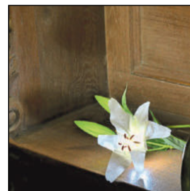
Mönch Marcword von Spiegel findet eine den Tod verheißende »Lilie von Corvey« auf seinem Chorstuhl. Er legt sie auf den Sitz des hochbetagten Bruders Weribald.