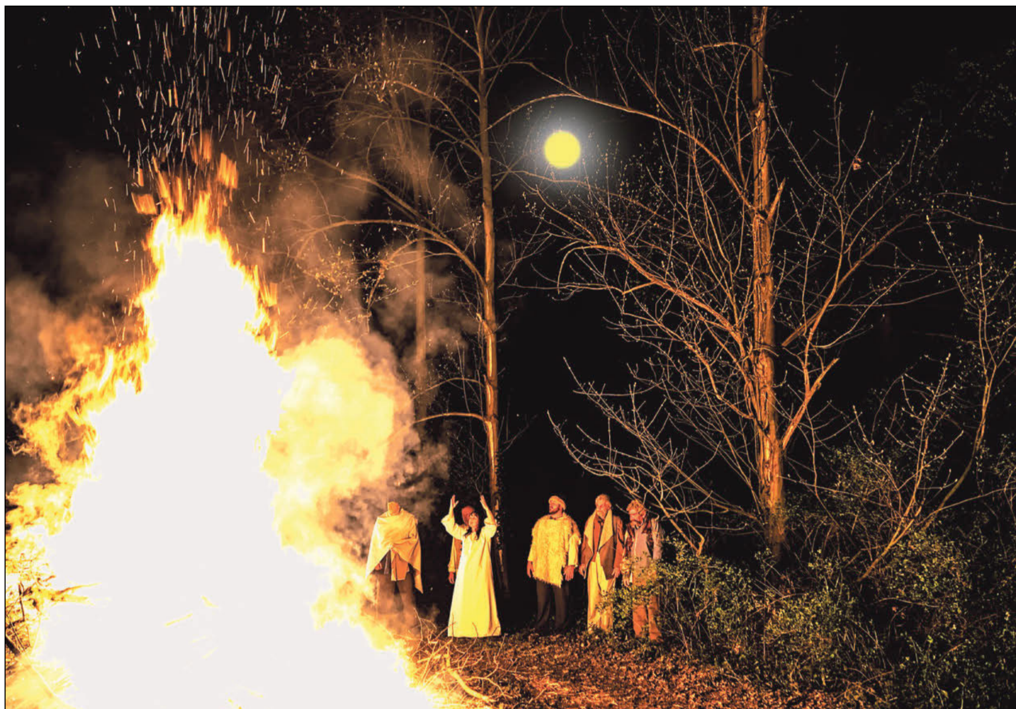
Die Irmsul, höchstes heidnische Heiligtum in Westfalen, wird im Auftrag von Kaiser Karl vernichtet. Die Germanen werden mit Feuer und Schwert bekehrt. Einer Legende nach stand die Säule bei Bad Driburg. Die Szene aus dem neuen Filmprojekt von Peter Schanz wurde bei einem Osterfeuer in diesem Jahr gedreht.