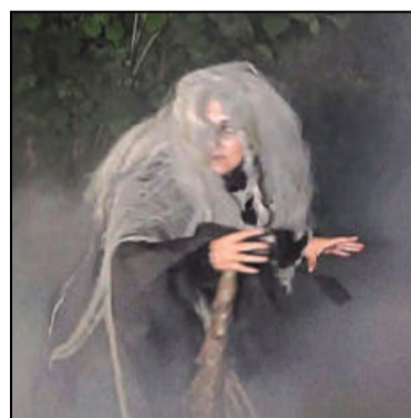
Trunkenbolde mussten den »Bachstüpp« im östlichen Westfalen fürchten. Die Sagen-gestalt lauerte späten Siechern auf und prügelte sie angeblich zur Vernunft.