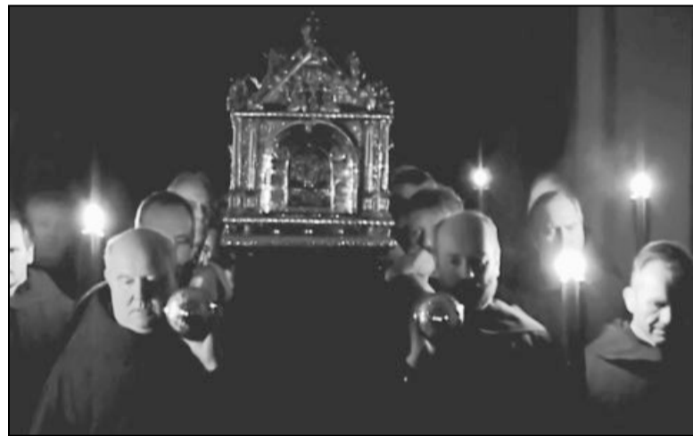
Die Paderborner Geisterprozession als schwarz-weiße Spielszene: Filmkomparsen sind die Träger des Liborischreins, denn nur sie dürfen die Originalrequisite tragen.

Einen Filmtrailer gibt es auf blautann-film.de